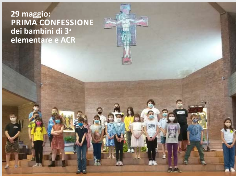
29 maggio: PRIMA CONFESSIONE dei bambini di 3 a elementare e ACR