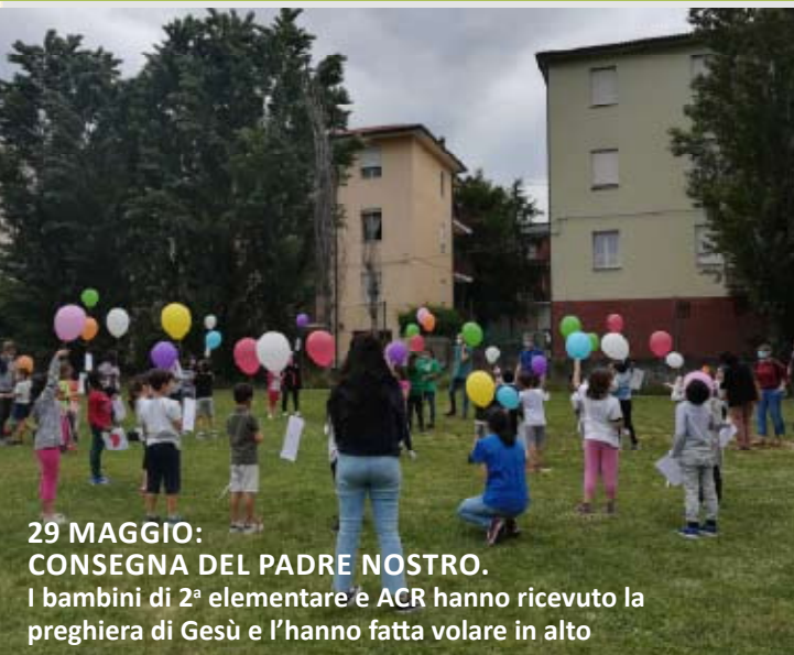
29 MAGGIO: CONSEGNA DEL PADRE NOSTRO. I bambini di 2 a elementare e ACR hanno ricevuto la preghiera di Gesù e l'hanno fatta volare in alto