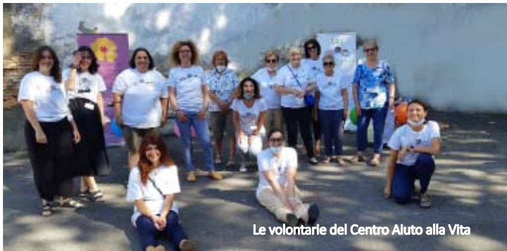
Le volontarie del Centro Aiuto alla Vita

Non sappiamo più capire la Vita. Invece di insegnare ai giovani a scegliere la Vita, a trovare e scoprire la Gioia anche in quelli che sembrano errori, perché la realtà ne è comunque piena, gli insegniamo a rimediare fuggendo, cancellando tutto, come se si potesse fare davvero.